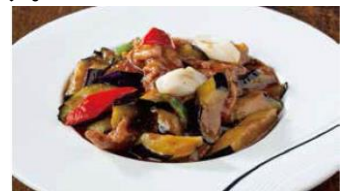
秋茄子と豚肉の甘辛炒め 特別価格 100g 238円 (通常価格 100g 298円)