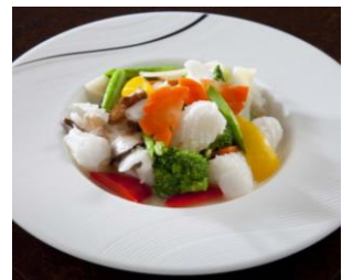
松笠イカと旬彩の塩炒め 100g 350円