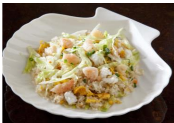
海鮮レタス炒飯 735円

主菜・主食から副菜まで、ヘルシーで毎日食べても飽きない中華料理をバラエティ豊かに展開いたします。