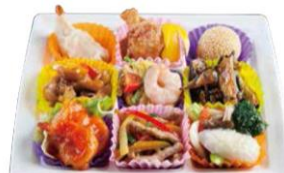
味めぐりプレート 特別価格 900円 (通常価格 980円) 1日限定 30セット