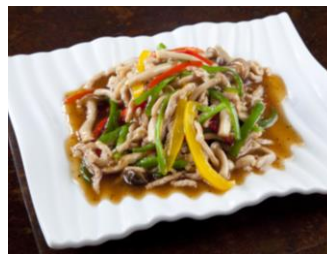
豚肉と三色ピーマン細切り炒め 100g 356円