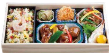
豚ヒレ肉彩弁当 特別価格 1,080円 (通常価格 1,180円) 1日限定 30セット